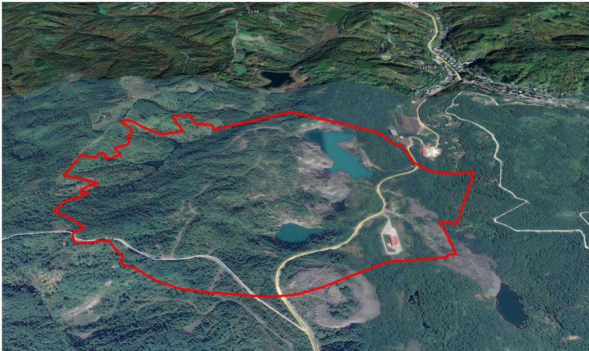
Приказ обухвата Плана

Предмет измјене дијела важећег Плана је измјена позиције – локације творнице експлозива. Основним Планом творница експлозива је била планирана јужно од постојећег објекта сервисно-погонске радионице у котлини затвореној са источне стране одлагалиштем јаловине а са западне стране брдом Томруци. Измјеном Плана потребно је утврдити нову локацију творнице у склопу локалитета „Литица“ на ком је експлоатација жељезне руде окончана.