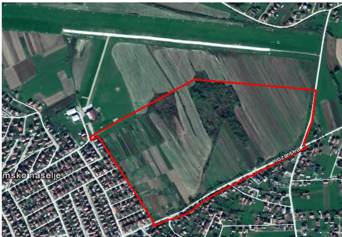
Приказ обухвата Плана

Иницијатива за израду Плана је покренута од стране Градоначелника Града Приједора, на основу исказаних потреба заинтересованог, конкретног инвеститора (Италијанска компанија „Calzedonia“)